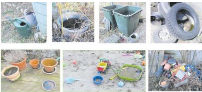
Bild 1: Brutstätten der Tigermücke: Verschließen, entleeren, kopfstehend lagern oder beseitigen.

Für ihre Mithilfe bedanken wir uns herzlich!