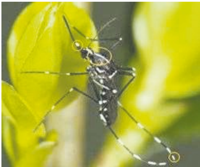
Bild 3: Asiatische Tigermücke ( Aedes albopictus ) Auffallend ist der weiße Streifen auf Kopf und Rückenschild.

Für Ihre Mithilfe bedanken wir uns herzlich!